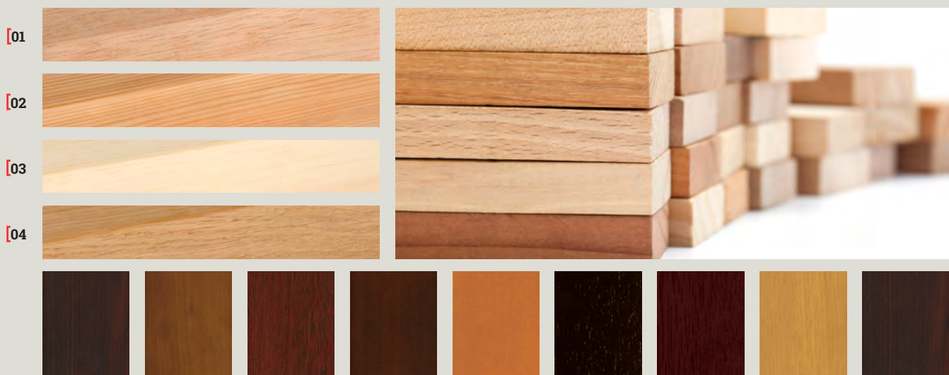
[01 Eucalyptus Grandis [02 Mélèze [03 Pin [04 Chêne